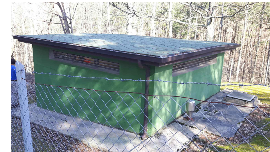
- Fotografia 6