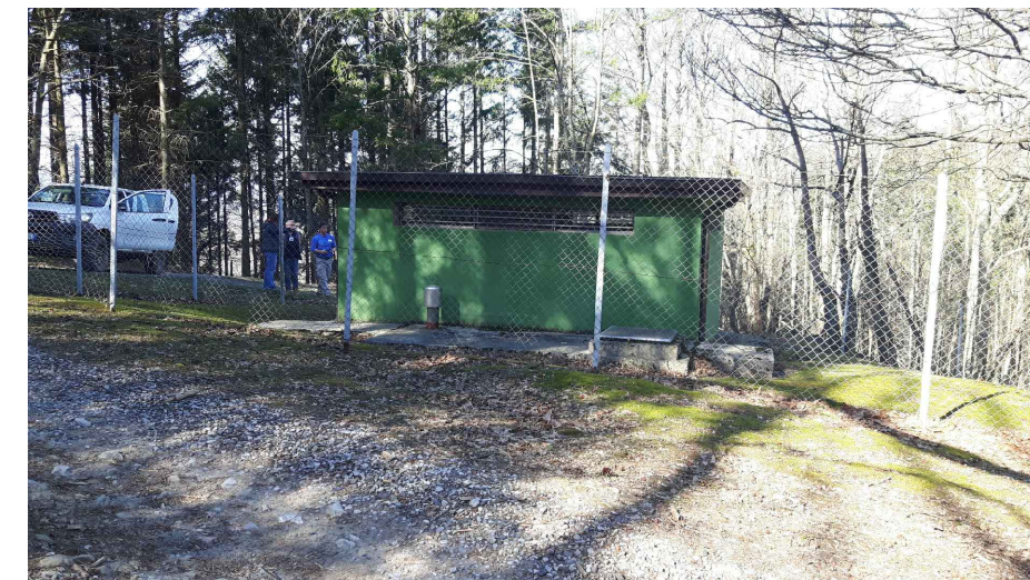
- Fotografia 5