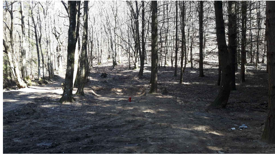
- Fotografia 1 - (Sez. 1)