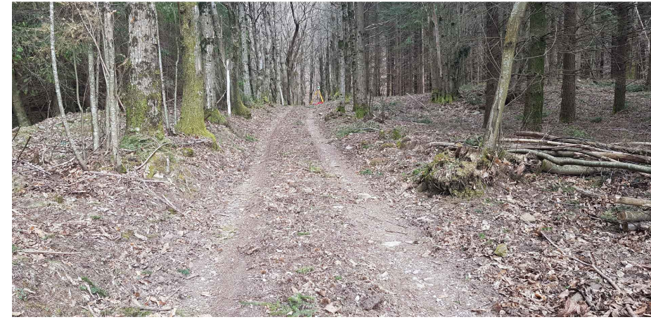
- Fotografia 3 - (Sez. 3)