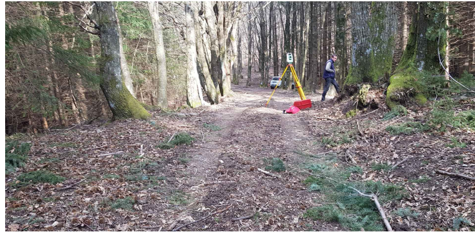
- Fotografia 2 - (Sez. 2)